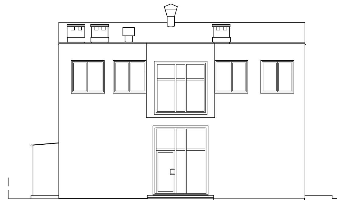
ELEWACJA PÓŁNOCNA skala 1:100